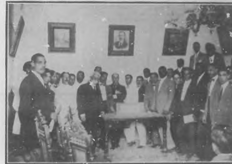
DIRECTIVA DEL PARTIDO NACIONAL OBRERO

go, el tipo preñado, con extensas disposiciones para abordar, en el mismo ramo de Instrucción Pública, tareas más árduas y delicadas que las del aula, y seguramente obtendrá la gloria y el éxito que en sus empeños ganan los luchadores.