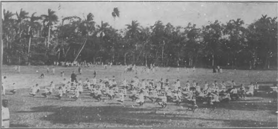
EN LUYANO.—En la finca que poseen los PP Jesuitas, se realizan los ejercicios gimnásticos de que la fotografía da idea, por los alumnos que se preparan para la gran fiesta que se celebrará el 20 de Mayo.