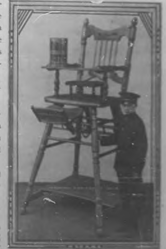
8. Silla para niños último modelo inglés. Diez sillas es la que la Nestlé and Anglo Swiss Co ofrece á los concursantes entre los cuarenta regalos 20.

Los premios se exhiben en "Palais Royal", Obispo y Compostela.