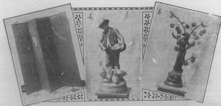
LOS REGALOS DE NUESTRO CONCURSO. - Figura de Biscuit "Dando de comer á los Patos" de gran valor artístico; mide 10 centímetros de alto. - 8. Figura de bronce que representa "La Poesía" con tres luces eléctricas del mejor efecto; mide 34 centímetros de alto. - 10. "Paravent" japonés bordado en seda color verde oscuro, muy elegante.

Queriendo la Compañía que el acto del escrutinio revista los caracteres de un acontecimiento, propónese que el acto de la distribución de premios sea una gran fiesta social, y que sean distribuidas entre los niños asistentes á la