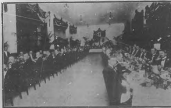
Banquete en honor del príncipe Alberto que estuvo en la Habana, organizado por la colonia inglesa. En representación del príncipe asistieron el comandante y oficiales del "Cumber-Land".

De aquí que nadie con más méritos y condiciones para desempeñar, según se indica ya, un cargo técnico, y con ello no se hará otra cosa que premiar, justiciariamente, su competencia en asuntos pedagógicos, y su noble, severo y tenaz empeño de haber cumplido siempre, estrictamente sus deberes oficiales.