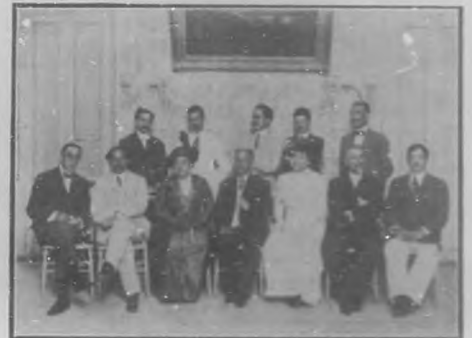
REUNION DE ARTISTAS EN EL ATENEO

Después de esto, únase á ello su carácter afable, su excelencia como padre de familia, la distinguida consideración de que goza como individuo social, y tendremos, desde lue-