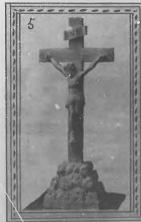
LOS REGALOS DE NUESTRO CONCURSO.

cupón que publicamos y de los que aparezcan en la prensa diaria de esta Capital, pueden usar las etiquetas que llevan los envases de la harina lacteada Nestlé, no la envoltura superior sino la que viene pegada al envase, procurando seguir las indicaciones del Cupón, haciéndose saber que será nula toda etiqueta que llegue á nuestro poder sin llevar este requisito.